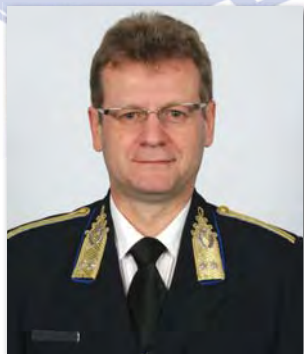
Samu István r. vezérőrnagy rendészeti főigazgató az országos rendőrfőkapitány helyettese