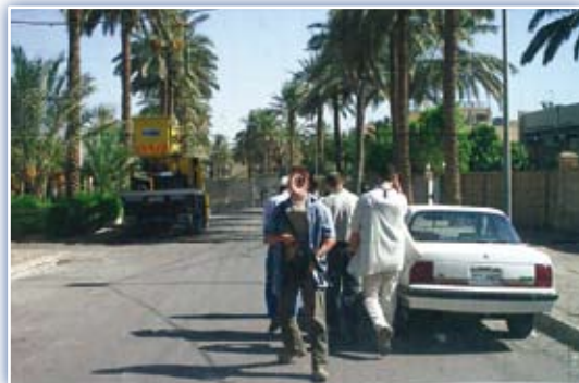
Képek Afganisztánból és Irakkból