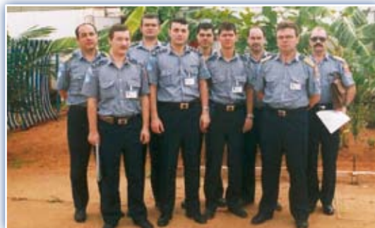
Magyar UNAVEM rendőrök

Rendőreinket következő küldetésük ismét az afrikai kontinensre szólította. Ezúttal Nyugat-Szaharába keltek útra és 21-en teljesítettek itt szolgálatot 1995 februárja és 2001 júniusa között.