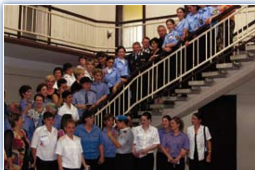
Képek a boszniai és a grúziai ENSZ rendőri missziókból