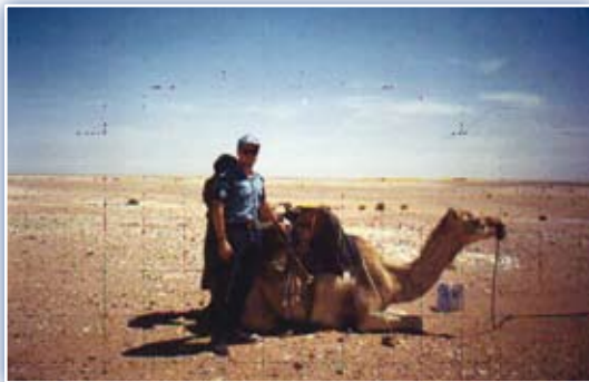
Magyar rendőr járőr Nyugat -Szaharában

A jugoszláviai polgárháború fontos szakasza zárult le 1995. decemberében, a Daytoni Békeegyezmény aláírásával. Alig egy hónappal az aláírás után a magyar rendőrök már Szarajevóban voltak az új misszió előkészítése érdekében. Az ENSZ Nemzetközi Rendőri Különítményébe (NRK) 1996. március elején érkezett meg az első, 35 fős kontingens. A helyzet nagyon bonyolult volt, hiszen három köz-