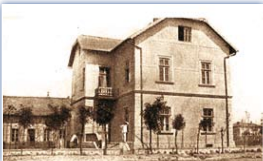
Az osztrák-magyar békemisszió parancsnoksága Üskübön

vóba került. A csendőrkerülethez 23 szárnyparancsnokság és 82 órs tartozott. A kerületben 277 török csendőr szolgált. A nemzetközi ellenőrzéssel működő csendőrség feladata a vidék közrendjének biztosítása, a fegyveres csoportok felszámolása volt. Az osztrák-magyar koszovói csendőrkerület parancsnokság augusztus 26-án a helyi lakosság szimpátiatüntetésétől kísérvé hagyta el Üsküb városát.