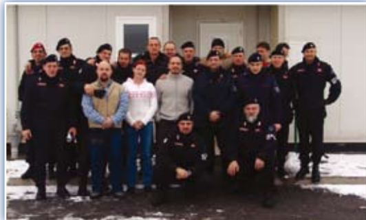
Magyar rendőr szakasz és különleges nyomozó csoport az EUFOR ALTHEA misszióban Bosznia-Hercegovinában 2005-2006-ban

A jelenleg folyamatban lévő nyolc civil, egy katonai és két összetett (civil-katonai jellegű) EBVP műveletben jelenleg mintegy 2500 katonai és 2500 polgári szakértő (bíró, büntetés-végrehajtási, közigazgatási, pénzügyőr, rendőr, ügyész, választási szakértő stb.) teljesít szolgálatot. A polgári válságkezelői létszám az EUPOL Afganisztán misszió tervezett bővítésével és a koszovói EBVP művelet létszámának fel-