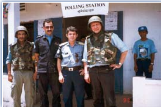
Képek a namíbiai és a kambodzsai ENSZ missziókból

magyar kontingensnek is. Búcsúztatásuk az osztrák rendőrség felajánlása alapján a Schwechati repülőtéren történt 1989. április 25-én, az osztrák rendőri kontingenssel közösen. A kontingensparancsnok a magyar kontingens irányítása mellett ellátta a dél-namíbiai körzet ENSZ rendőrfőkapitányi beosztását is. Az állomány tagjai pedig ENSZ rendőrállomásokra kerültek, ahol nemzetközi mezőnyben kellett ellátniuk a rendőri megfigyelői és ellenőrzési feladataikat. A misszió közel egy évig tartott és összesen 24 ország 1750 rendvédelmi szakembere, úgynevezett „polgári rendőre” vett benne részt.